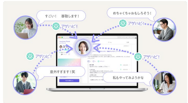
「Happiness Planet Connect」のイメージ図