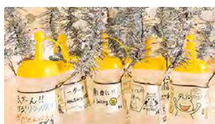
選手たちからのメッセージ入り給水ボトル▲