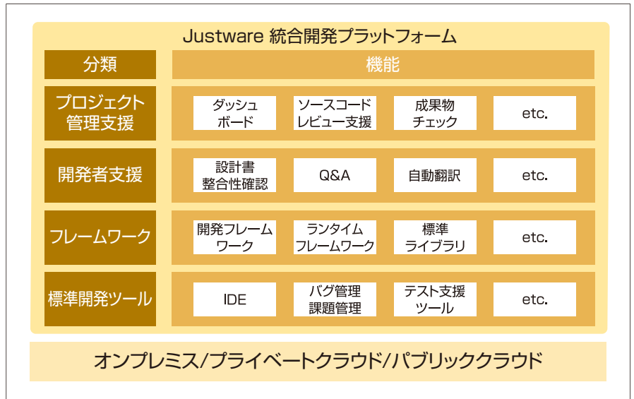
Justware統合開発プラットフォームの全体像

オープンプラットフォーム環境におけるアプリケーション開発を支援するHitachi Application Framework「Justware」を提供。Java TM 標準仕様であるJava EE TM ベースまたはOSSベース(Spring+MyBatis)から選択が可能です。エンタープライズアプリケーションに必要な信頼性・拡張性を確保しつつ開発の容易性を高めるランタイムフレームワーク、汎用性の高い機能 はんよう を中心に整備した標準ライブラリを提供します。また、設計情報をリポジトリで一元管理することで、データ項目の統制、トレーサビリティの確保、ソースコードの自動生成を