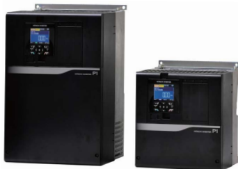
インバータ SJシリーズ P1