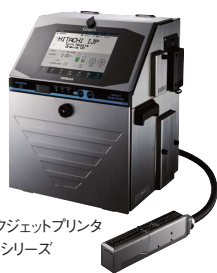
産業用インクジェットプリンタ Gravis UX シリーズ