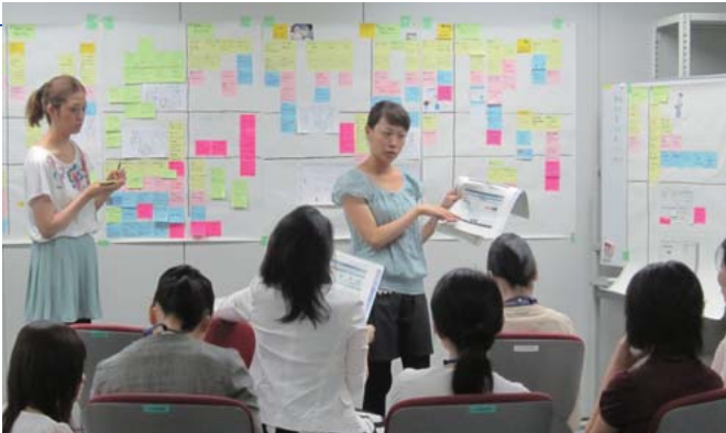
協創ワークショップ風景