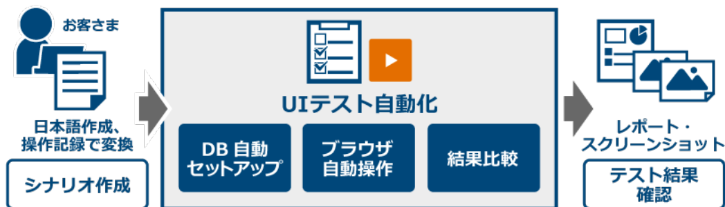
図 1 | 「Justware UI テスト自動化ツール」のイメージ

「Justware UI テスト自動化ツール」は、日立のシステム開発ノウハウをベースとし、データベースのセットアップ自動化やエビデンスの収集管理など、エンタープライズレベルで開発する Web アプリケーションの UI テスト工程の効率化をトータルに支援するものです。あらかじめ作成したテストシナリオに沿って Web ブラウザを自動で操作し、スクリーンショットの取得やテスト実行後の画面およびデータの結果を比較することで、Web アプリケーションの UI テストを自動化します。同じテストを繰り返し実施するリグレッションテスト *1 に適用することで、テスト工数の削減とテスト時間の短縮を実現し、デリバリースピードの加速に貢献します。