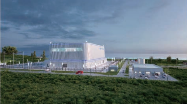
BWRX-300 発電所完成イメージ図