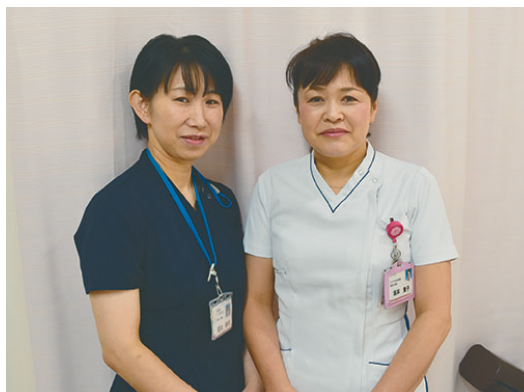
整形外科外来スタッフ

整形外科外来は、看護師2名が勤務しています。様々な疾患で手術を受ける患者さんも多いため、不安なく診察・治療を受けられるよう、医師と患者さんの橋渡しができるよう心がけています。