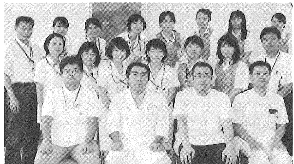
私たち健診スタッフが皆様の健康管理をサポートさせていただきます!!

当健診センターの人間ドックでは、がんなどの早期発見のために精度の高い検査、生活習慣病予防のための保健師による適切なアドバイス、介入、ひたちなか総合病院での迅速な精密検査予約などにより、受診後のフォローアップ体制も充実しております。是非、ご自身とご家族の健康管理に当健診センターの人間ドックをご活用下さい。