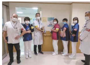
(医療事故防止対策委員会)