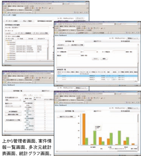
上から管理者画面、案件情報一覧画面、多次元統計表画面、統計グラフ画面。