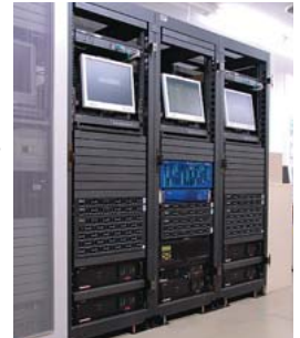
サービス総合管理システム「COSMIC」を支えるHA8000サーバ

約70万ステップものプログラム移行とデータベース変換を1年の間に着実に進め、最後の2日間で一気に切り替えを図った新COSMICプロジェクトは2006年10月、予定どおりカットオーバーを果たしました。