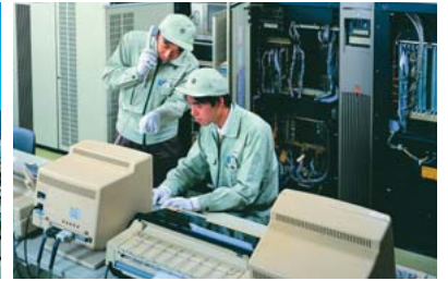
社会インフラを担う幅広い企業に導入されている制御用コンピュータ