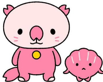
サクラッコ・ララガイ