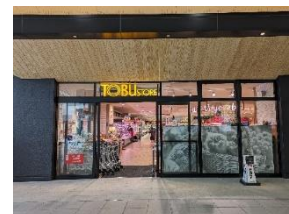
東武ストア 越谷店

*4 決済端末の操作開始から、お買い物終了でレシートが出るまで。商品スキャンの時間を除きます。通常の利用は、東武ポイントアプリの提示、クレジットカードの差し込みでの決済を比較対象としています。