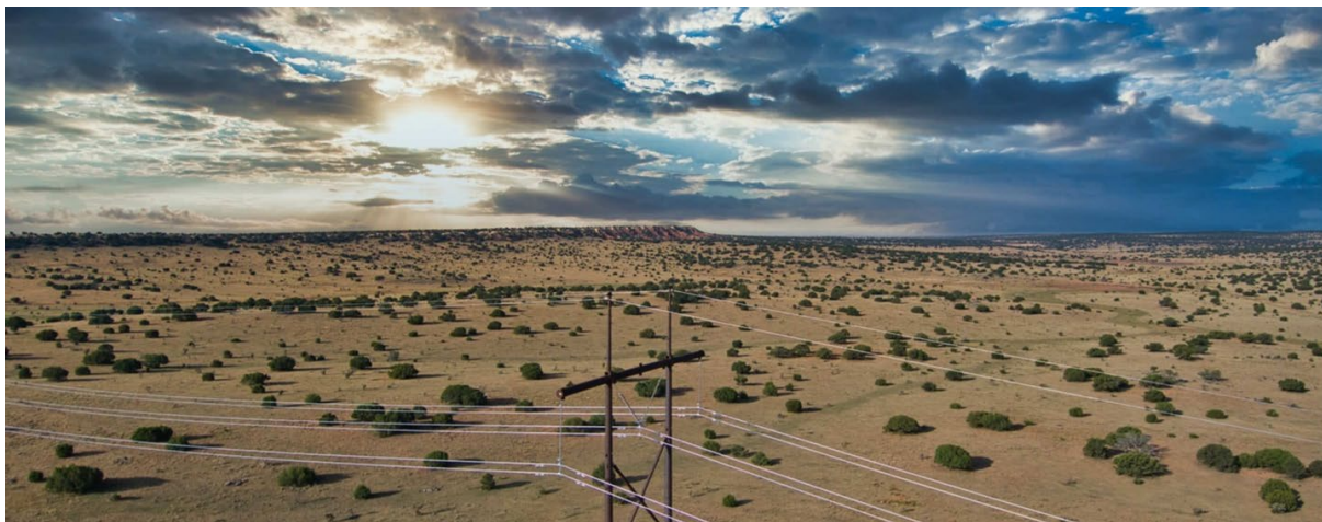
サンジア送電プロジェクトの建設予定地

米国西部に再生可能エネルギーを供給するプロジェクト向けに、複数年のサービスを提供