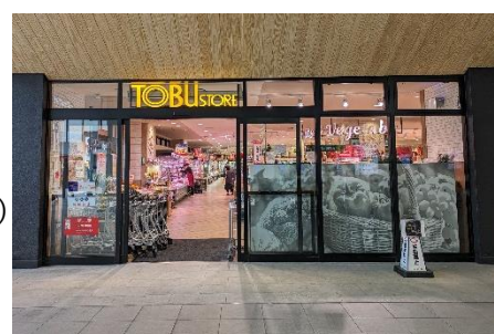
▲東武ストア 越谷店