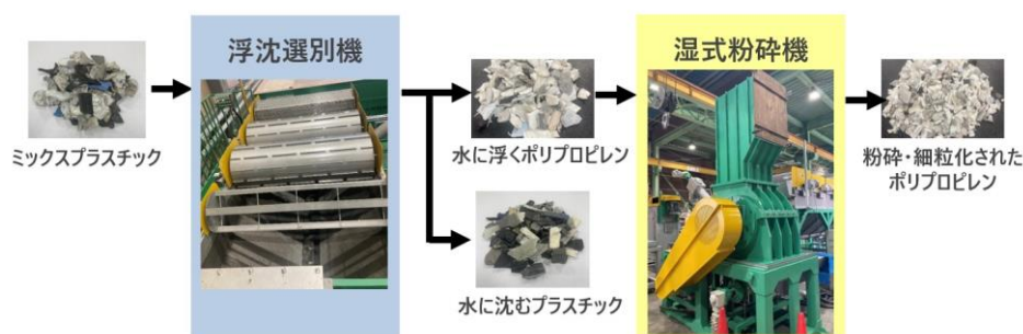
図2：ミックスプラスチック選別時の主な工程

ミックスプラスチック選別装置は、「浮沈選別機」や「湿式粉碎機」、「ろ過装置」、「脱水機」などで構成されます。材質の異なるものが混在するミックスプラスチックの選別工程は大きく 2 つに分かれており、まず初めに「浮沈選別機」の工程では、ミックスプラスチックを水に浮かべて、ポリスチレンなどの水に沈むプラスチックと、水に浮くポリプロピレンに選別します。次の「湿式粉碎機」の工程では、選別したポリプロピレンを粉碎して粒の大きさなどの調整を行い細粒化するとともに、表面を洗浄して汚れを取り品質を向上させます。