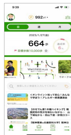
「PHR アプリ *3 」の画面例 (イメージ)

具体的には、大阪市都島区医師会の協力のもと同区内の医療機関と介護事業所が参画し、患者に日々のバイタル情報や問診結果を「PHR アプリ」や「地域連携手帳」に入力いただき、そのデータを「阪急阪神みなとわ」を通じて、医療機関や介護事業所に迅速かつ安全・確実に共有します。これにより疾病の重症化や再発を減らし、患者・家族のQOLの向上、医療・介護費の適正化につながるかどうか、また現場での観察・記録・報告などの事務作業をデジタル化することで作業負担を軽減できるかどうかについて検証します。