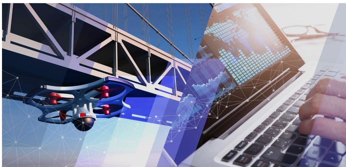
ドローン運航システムを活用したインフラ設備点検と「設備点検 AI プラットフォーム」の連携イメージ

株式会社日立製作所(以下、日立)は、このたび、地域社会を支える社会インフラの強靱化に向けて「設備点検 AI プラットフォーム」(以下、本プラットフォーム)を開発しました。本プラットフォームは、インフラ事業者をはじめ、AIベンダーなどのベンチャー企業や大学、研究機関といった多種多様なステークホルダーと連携し、優れた技術やノウハウを取り込んでいくオープンなプラットフォームです。複数のインフラ事業者を中心に実証を重ね、地域全体でのインフラ管理の効率化やコスト最適化をめざします。