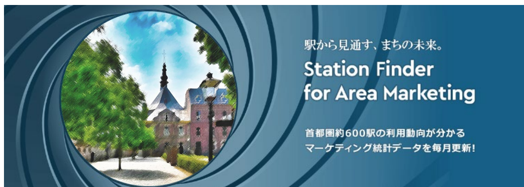
専用 Web サイト トップ画面

https://www.hitachi.co.jp/products/it/stationfinder/index.html