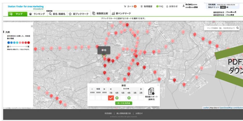
Station Finder for Area Marketing

JR 東日本が開発・提供する首都圏約 600 駅の各駅の利用状況を示す 定型レポート「駅カルテ」(PDF・統計情報)を販売