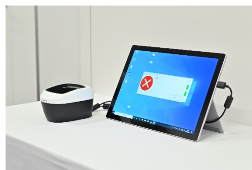
(本人以外の認証画面)

次回の実証では、デジタル庁が推進する VRS (Vaccination Record System : ワクチン接種記録システム) のワクチン接種履歴とのデータ連携や、国際標準「スマートヘルスカード」に準拠したデータ仕様の実装を予定しています。また、オフィスビル以外の場所 (学校・病院・イベントホール・レストラン・観光地・建設現場) など対象範囲を広げるべく検討していきます。