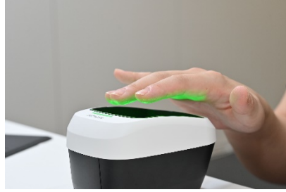
(非接触型指静脈認証装置での指静脈登録)