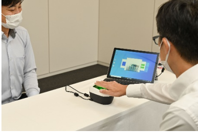
(指静脈の事前登録)