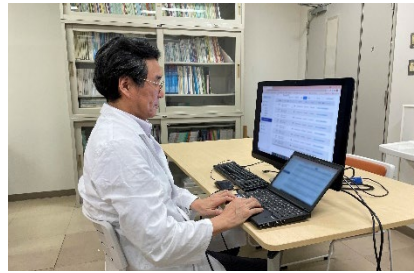
(九州大学病院の医師による判定)