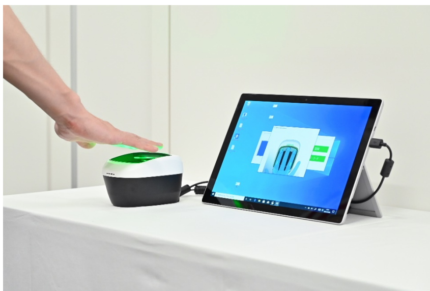
デジタルヘルス証明と生体認証技術を活用した入室管理

9月27日～10月6日には鹿島が所有する「赤坂 K タワー」(東京都港区)にて、実証への協力に同意した同社の従業員を対象に、ワクチン接種履歴などの事前登録から検査の実施、デジタルヘルス証明発行、オフィス入館までの一連の技術検証を実施しました。今後、オフィスなど建物内での実装に向けた準備を進めるとともに鹿島の建設現場などにおいても共同実証を行う予定です。