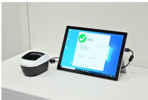
(本人認証後の画面)