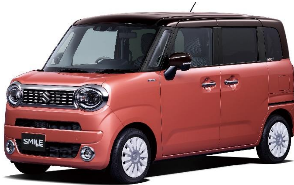
当社のステレオカメラが搭載された新型「ワゴン R スマイル」