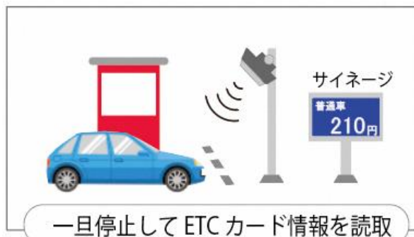
E T C 読取イメージ