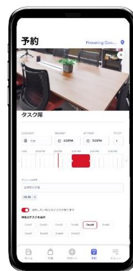
本社オフィスのオープンエリアイメージ(左)と就業者ソリューション「BuilPass」のスマートフォンアプリ画面イメージ(右)

株式会社日立製作所(以下、日立)と、株式会社日立ビルシステム(以下、日立ビルシステム)は、このたび、新常態(ニューノーマル)時代の働き方の実験場として、日立ビルシステムの本社地区のオフィス(東京都千代田区および東京都足立区)のリニューアルを行い、2021年8月2日から運用を開始します。本オフィスリニューアルは、2020年7月に立ち上げた、若手社員40名のプロジェクトチーム主導で検討を進めてきたもので、フリーアドレス制を採用し、執務エリアを集約する一方で、社員がリフレッシュを図り、仕事の創造性を高められる空間をめざしたオープンエリアを新設するほか、日立のビル分野における Lumada *1 の最新ソリューションである就業者ソリューション「BuilPass(ビルパス)」 *2 とビルIoTソリューション「BuilMirai(ビルミライ)」 *3 を導入し、快適なオフィス生活を実現します。