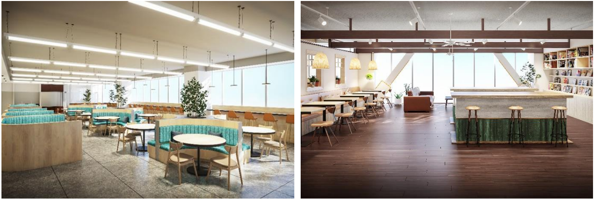
亀有総合センターの食堂施設(オープンエリア)イメージ