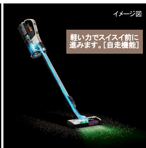
[図2 ごみをしっかり吸引しラクに掃除]