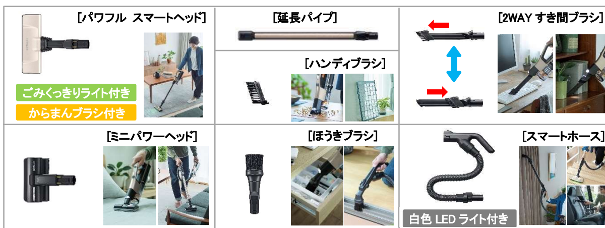
[図7 多彩なツールを組み合わせてさまざまな場所を掃除]