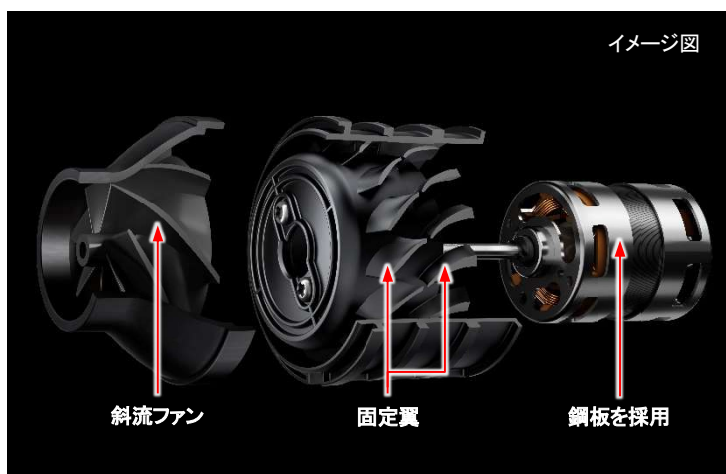
[図1 ジェット3Dファンモーター]

きわだつパワーと軽量化、そして軽い力でヘッドがスイスイ前に進む「自走機能」により、ごみをしっかり吸いながらラクに掃除ができます(図2)。