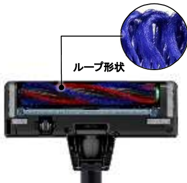
[図5 からまんブラシ]