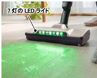
[図3 ごみくつきりライト]