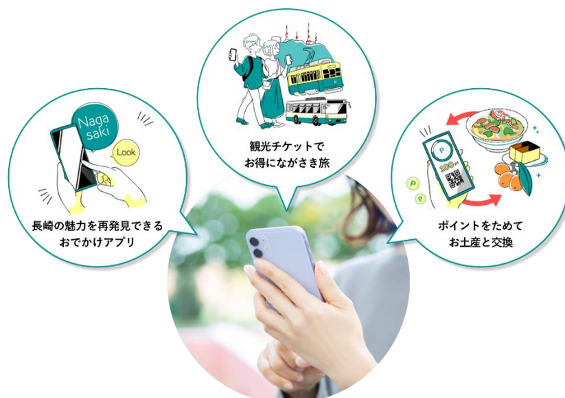
長崎市での観光 MaaS サービスの利用イメージ

地図情報とデジタルチケット・決済技術を組み合わせ、 新たな観光型 MaaS 基盤の開発を目指す