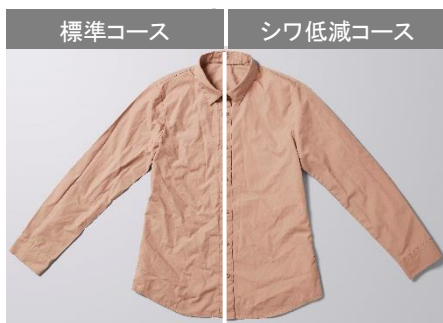
シャツ (防シワ加工なし/ポリエステル 65%・綿 35%)

「シワ低減」コース (*1) では、洗い時に加え、乾燥時に衣類をかくはんする制御を採用し、衣類がからみにくい動かし方をする事で、乾燥時にシワが付きにくくなるように改善しました。また、新ファンモーターを開発し、標準コースに比べ風速をアップ (*2) させた風をあてることで、シワを抑えてきれいに仕上げます(図 1、図 2)。