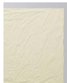
ハンカチ (綿 100%)