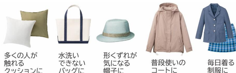
多くの人が 触れる クッションに

「除菌清潔」コース (*5) では、水道水のミストを衣類に吹きつけて温風で加熱。衣類に湿気を加えることで熱を伝えやすくし、除菌 (*6) ・消臭します。水で洗えないものにも使え、また、槽全体を低速回転させることで形くずれが気になるものにも使えるので、クッションや帽子、普段使いのコート、毎日着る制服など、頻繁に洗濯ができなくて困っていたものも清潔に使うことができます(図 3)。