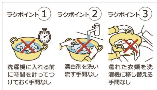
【図 4 「つけおきプラス」の楽ポイント】

運転したいコースに「つけおきプラス」 (*) を設定すると、洗濯行程に 30 分のつけおき運転が追加されます。漂白剤を溶かしたり、つけおきした後の濡れた衣類を洗濯機に投入するなど、これまでつけおき洗いかかっていた手間を低減します(図 4)。また、本機能は標準コース以外にも、さまざまなコースで設定することができます(図 5)。例えばおしゃれ着コースに「つけおきプラス」を設定すれば、おしゃれ着を優しく洗いながら、汚れもしっかり落とせるなど、お客様の多様なニーズに合わせた洗い方ができます。