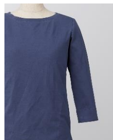
カットソー (ポリエステル 79%・綿 18% ・ポリウレタン 3%)