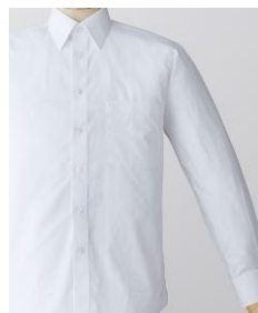
形態安定シャツ (防シワ加工あり/ ポリエステル 65%・綿 35%)