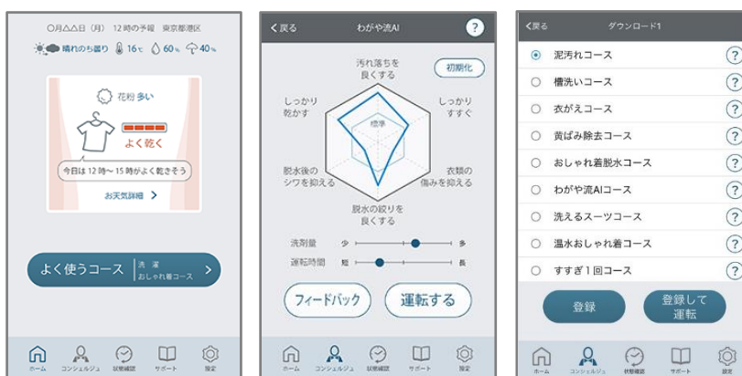
「洗濯アドバイス機能」

本製品は「洗濯コンシェルジュ」アプリに対応しており、洗濯機本体に搭載されていない洗濯のコースをスマートフォンからの操作でダウンロードして増やせます。「洗濯アドバイス機能」では、その日の洗濯指数から乾きやすい時間帯をアドバイスし、洗濯物が乾きにくいときは部屋干しや乾燥までの運転をおすすめしてくれます。「わがや流 AI」コースでは、洗い上がりに関するお客様の評価を学習して、好みの仕上がりに近づけていきます。また、「スマートスピーカー連携機能」では、音声で洗濯の残り時間や洗濯機の運転終了などを確認できるので便利です(図 6、図 7)。