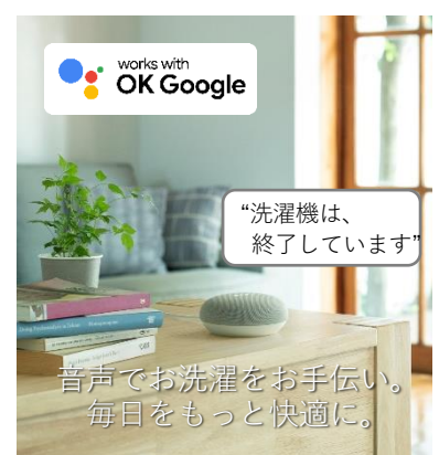
【図 7 スマートスピーカー連携】

※ Google、Google Nest Mini は Google LLC の商標です。