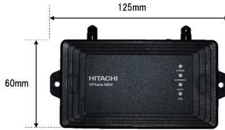
コンパクトな本体

LTE 通信用および無線 LAN 用のアンテナを内蔵したオールインワンの本体は、質量 85 グラムの軽量、かつ、手のひらサイズでコンパクトな本体のため既設の装置・機械の狭小なスペースにも設置可能です。また、電源は DC5V \sim 24V に対応しているため、工場に設置される装置・機械をはじめ、フォークリフトや工事車両などの移動する機械にも容易に設置することができます。