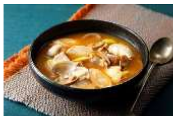
簡単！美味しい！スンドウブチゲ♪ by misacoco