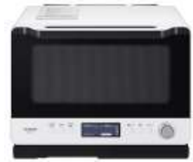
フロストホワイト(W) MRO-W1Y

また、デザインは、2019 年度グッドデザイン賞を受賞した当社 2019 年度製品 MRO-W1X を踏襲しつつ、オートメニューが簡単に選べるように「料理」ボタンを新たに設置することで、操作をやすくしました。(図 5)