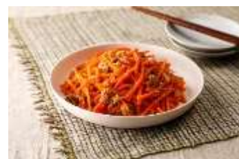
にんじんのツナごま by もこりこ