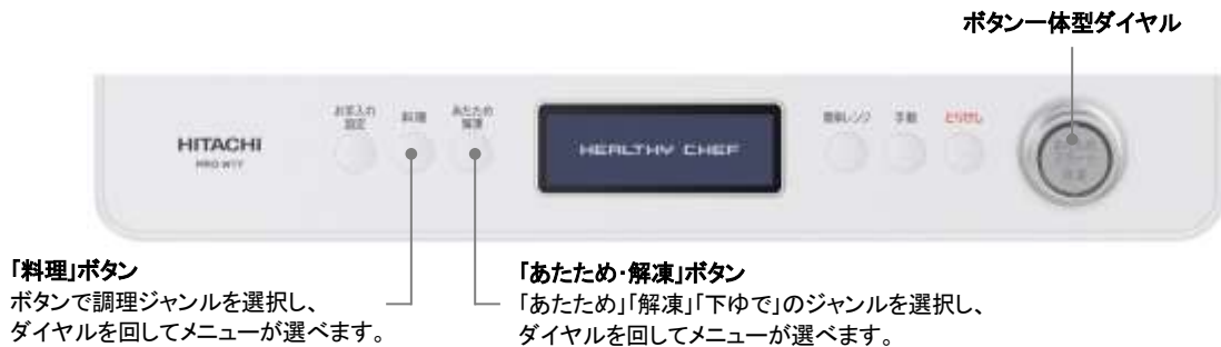
[図 5 MRO-W1Y の操作部イメージ]

(*7) 元レシピはレシピサービス「クックパッド」および各食品メーカーのホームページをご参照ください。搭載レシピ名は元レシピ名と異なる場合があります。