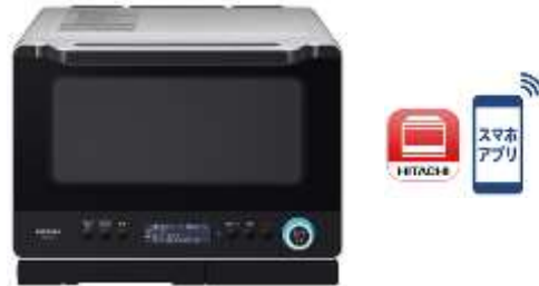
メタリックグレー(H) MRO-W10X

火加減おまかせ「W スキャン調理」に、「クックパッド」や食品メーカーと共同開発した魅力あるオートメニューを追加 過熱水蒸気オープンレンジ「ヘルシーシェフ」MRO-W10X のソフトウェアアップデート開始