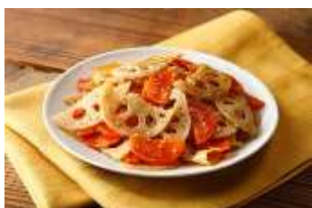
常備菜★レンコンと人参のきんぴら by トイロ*