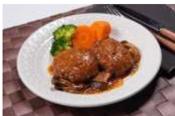
柔らかかじゅーしー煮込みハンバーグ by ニーナ41