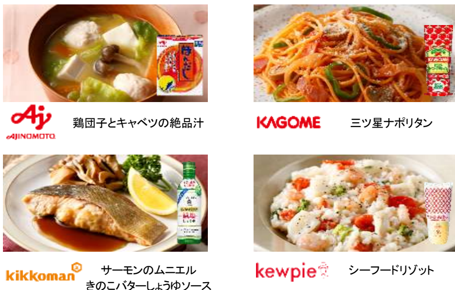
[図3 食品メーカーと共同開発したオートメニュー例]

おいしさにこだわる食品メーカー4社(味の素株式会社、カゴメ株式会社、キッコーマン食品株式会社、キューピー株式会社) (*5) と、「W スキャン調理」のオートメニューを共同開発しました。自宅にある定番の調味料を使って作れる20レシピ (*4) をオートメニューとして採用し、「W スキャン調理」の魅力あるメニューがさらに増えました。(図3)