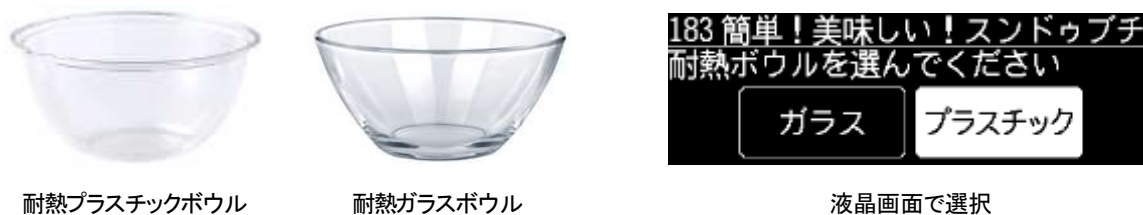
[図4 簡単プラボウルメニュー]

「W スキャン調理」オートメニューのうち、「簡単プラボウルメニュー」を従来の18から40メニューに拡充しました。軽くて割れる心配がなく扱いやすい耐熱プラスチックボウル (*6) で調理できます。ボウルに下ごしらえした材料を入れて加熱すれば完成するので、手軽に調理ができます。耐熱ガラスボウルの選択も可能です。(図4)