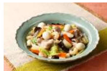
超簡単♡野菜たっぷり本格八宝菜 by nyaako ♡