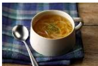
玉ねぎと生姜のスープ。 by ラビー