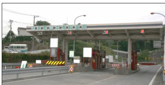
本町山中有料道路