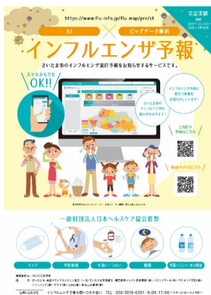
チラシ／ポスターイメージ

https://www.flu-info.jp/flu-map/pre/st （実証期間:2019年12月6日～2020年3月20日）