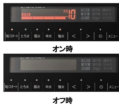
[図 6 表示部]