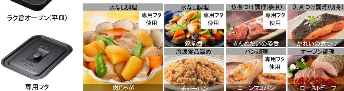
[図 1 専用皿、専用フタ]