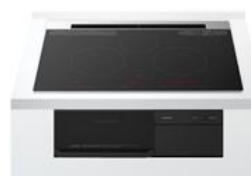
ディープブラック(K) HT-M8AKTWF

HT-M8AT シリーズは、「ラク旨グリル&オープン(専用フタなし)」を使った「魚焼き調理」に「冷凍のまま」メニューを追加しました。また、トッププレートは深みのあるディープブラック色とするとともに、外周に段差の少ない「薄形フレーム」を使用し、操作部表示には「1 色液晶」を採用しました。