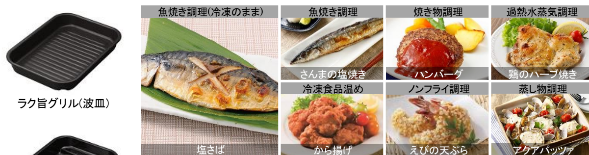
[図 2 ラク旨グリルオートメニューの調理例]

このように、オートでできる調理分類を「焼き物調理」「オープン調理」など 10 種類 (*)3 に拡充 (*)4 し、148 レシピに対応しているため、オート調理で料理をもっと作りたいというニーズにも応えます(図 2)(図 3)。