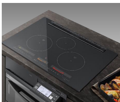
[図 4 フラットトッププレートプレミアム]

さらに、表示部は、火力の強さを 4 色でわかりやすく表示する「4 色カラー液晶」に、表示したい文字等のみ透過させる NB モードの液晶 (*5) を採用することで、オフ時の表示がすっきりとし、キッチンと美しく調和します(図 6)。「火力バー」は「ワンタッチ火力ボタン」と連動していて、火力に合わせて光る色と面積が変わるので、見やすく、わかりやすくなりました(図 7)。