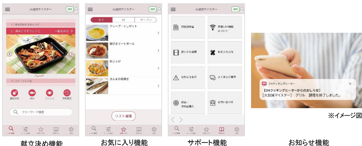
[図 8 日立 IH クッキングヒーターアプリ]

(*6) Android6.0 以上、iOS10.0 以降に対応予定です。インターネット接続環境と無線 LAN ルーターが必要です。Android は、Google LLC.の登録商標です。アプリのサービス内容・画面デザイン・機能は、予告なく変更することがあります。