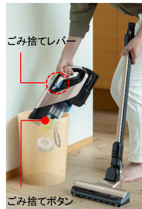
[図1 新ごみダッシュ機構]

掃除の後のお手入れを簡単にするために、ダストケースを本体から外さず簡単にゴミ捨てができる「ごみダッシュ」機構を進化させました。ダストケース下部にある「ごみ捨てボタン」は引き続き採用しながら、本体の取っ手部に「ごみ捨てレバー」を新採用しました。これにより手もとのレバーを引くだけのワンアクションで、外した延長パイプを持ったままでも簡単にゴミ捨てができます。また、「ごみ捨てレバー」を使うと本体をごみ箱の中まで入れやすくなるので、ホコリの舞い上がりを抑えます(図 1)。