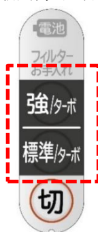
[図 2 手もと操作ボタン]

(*) ターボモードは「強」「標準」運転中に 5 秒間のみ動作します。5 秒経過後は自動で元の運転に戻ります。連続使用時間が短くなります。