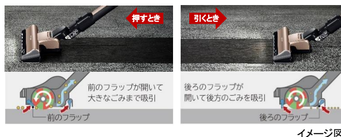
【図12 ダブルシンクロフラップ】