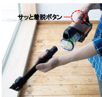
【図8 サッと着脱ボタン】