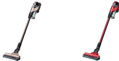
シャンパンゴールド(N) ルビーレッド(R) PV-BH900G

新「ごみダッシュ」機構でゴミ捨てがさらに簡単。「ターボ」モードで気になるゴミもしっかり吸引。 コードレス スティッククリーナー「パワーブーストサイクロン」を発売