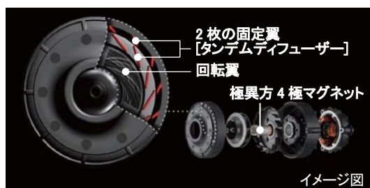
[図 4 小型ハイパワーファンモーターX4]