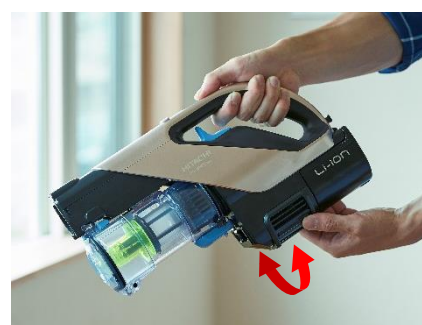
【図10 排気方向切替シャッター】