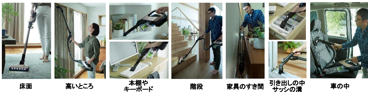
【図7 さまざまな場所の掃除】