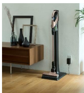
【図9 スタンド式充電台】