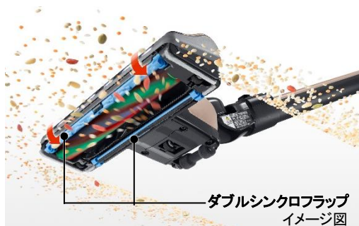
【図11 パワフルスマートヘッド】

自走式の「パワフルスマートヘッド」(図 11)は、押し引きに合わせて前後のフラップが同期して開閉する「ダブルシンクロフラップ」を継続採用しました。ヘッド内の圧力を上手に調整するため、フローリングはもちろん、じゅうたんなどにヘッドがはりつくのを抑えつつ、軽い操作で押しても引いてもごみを吸い込みます(図 12)。これにより、ごみの取り残しを減らします。