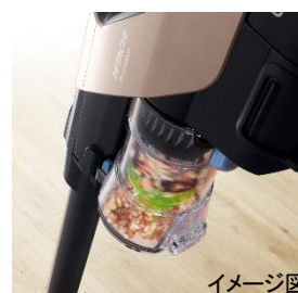
[図 5 パワーブーストサイクロン]