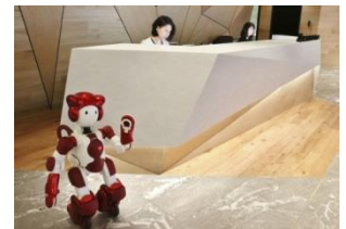
コミュニケーションロボット「EMIEW3」

未来のオフィスの可能性や、将来の街への本格展開を見据え、日立製作所及び日立ビルシステムの協力の下、コミュニケーションロボット「EMIEW3」の音声対話機能と自律移動機能を活用した受付案内の実証実験を当社新本社の大手町パークビル (2018年1月に大手町ビルより移転) にて実施しました。