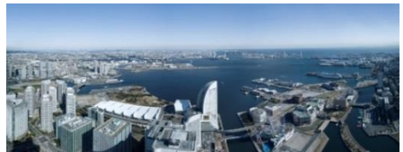
スカイガーデンからの眺望