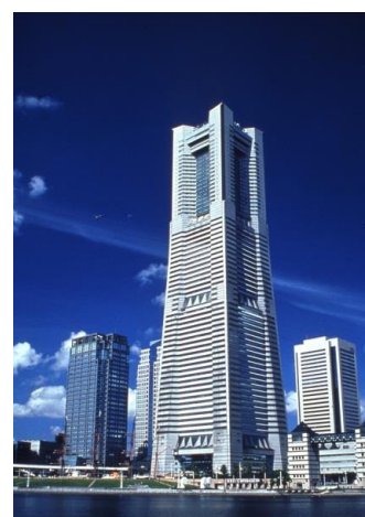
横浜ランドマークタワー