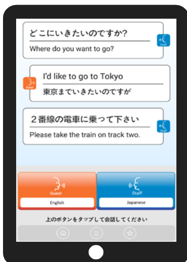
対話型の逐次翻訳