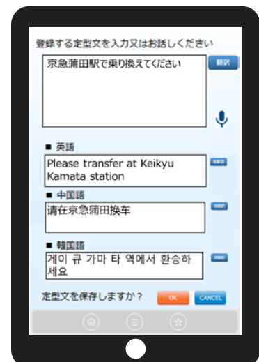
よく使うフレーズの自由登録・編集画面