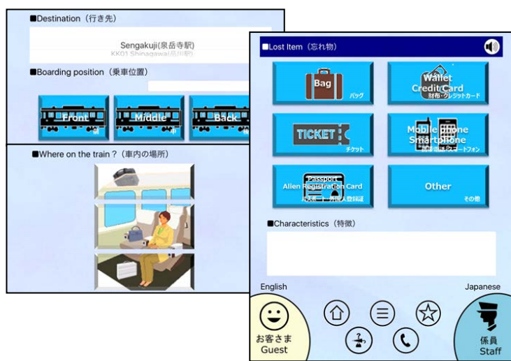
タッチパネル型のお忘れもの確認機能 (お客さま側が英語の例)