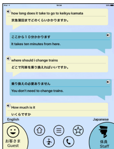
対話型の音声翻訳画面 (お客さま側が英語の例)