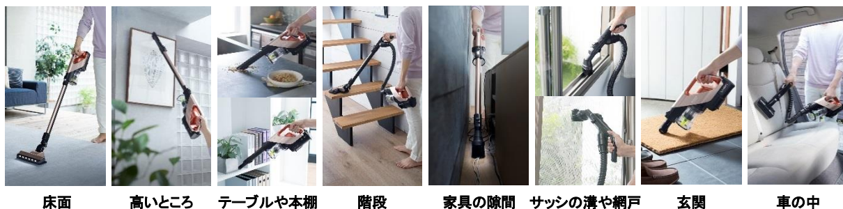
[図2 さまざまな場所の掃除]