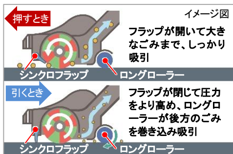
【図12 シンクロフラップとロングローラー】