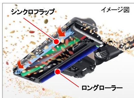
【図11 パワフルスマートヘッド】

「パワフルスマートヘッド」(図 11)は、ヘッド前側に前後の操作に同期して開閉する日立独自の「シンクロフラップ」を採用しました。これにより、ヘッドを押したときはフラップが開いて大きなごみも吸引し、引いたときはフラップが閉じることで床面との気密性を向上させ、ロングローラーがヘッド後方のごみを巻き込みながら微細なごみまでしっかり吸引します(図 12)。また、ヘッド幅を約 25cm とし、狭い場所での取り回しをやすくしました。さらに、壁ぎわのごみが取れやすい「きわびた」構造(図 13)や、暗い場所のごみが見やすい「LED ライト」(図 14)など、多彩な機能を採用しました。