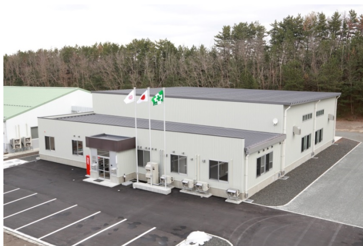
「能代サービスセンタ」「能代トレーニングセンタ」の外観