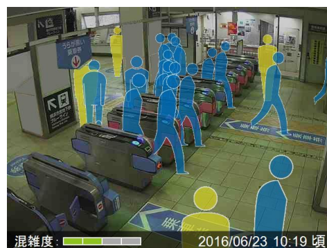
(配信画像イメージ)