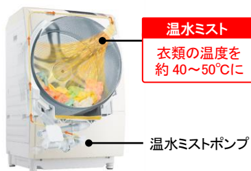
[図3 新方式のナイアガラ循環シャワー]