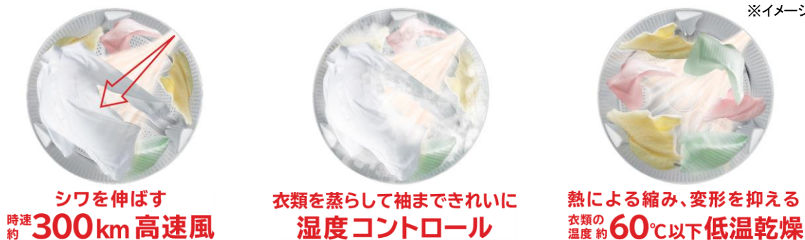
[図1 風アイロンの技術]