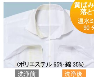
[図4 [温水]ナイアガラ洗浄]