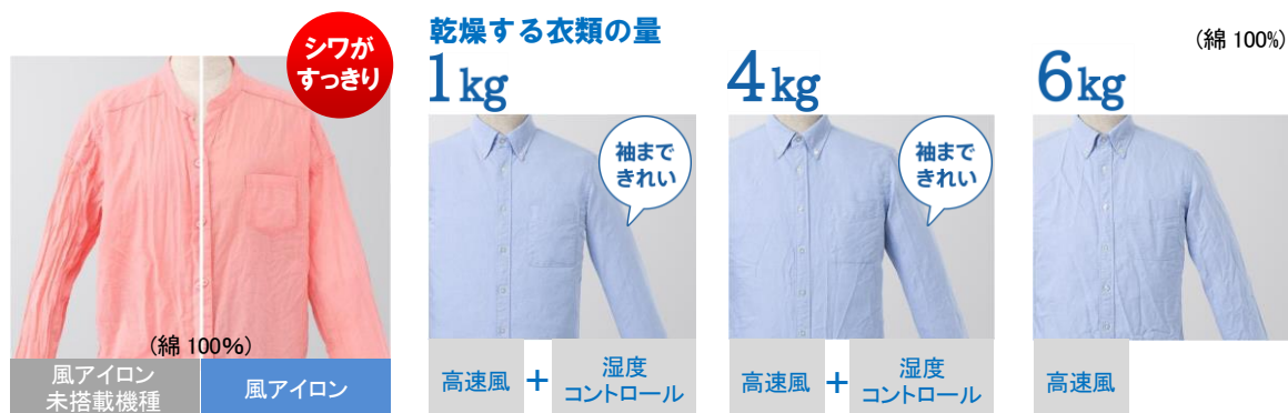
[図2 風アイロンの効果]