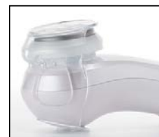
【図 3 保護キャップ】