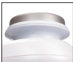
【図 1 新温熱ディンプルヘッド】

更に温熱ディンプルヘッドを保護する保護キャップを新たに付属し、コットンを固定するリングをつけたまま装着できるので、リングを紛失しにくくなりました。(CM-N4000 は、冷却ヘッドも保護できる形状です)