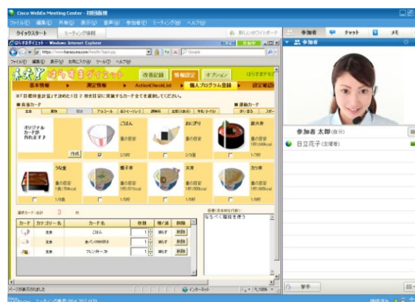
インターネットテレビ電話を活用した初回面接の画面*6