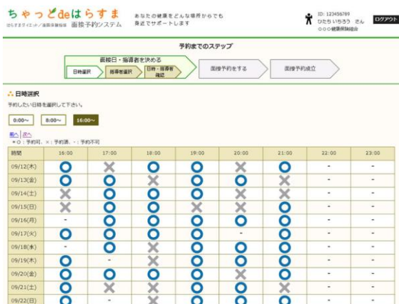
初回面接の日時が予約できる日時選択画面*6

参加者はタブレットや PC など任意の端末から指導者と実施する初回面接の日時を予約することが可能です。なお、指導者は夜間や休日にも初回面接に対応するため、参加者はインターネットテレビ電話を活用し自宅などから、忙しい平日の業務時間を避けて初回面接を実施することが可能です。また、本サービスで行う初回面接は、目標設定画面を双方の端末上に表示し、参加者と指導者がお互いの表情を確認しながら実施できるため、対面で行われていた初回面接と同等の質を確保しています。