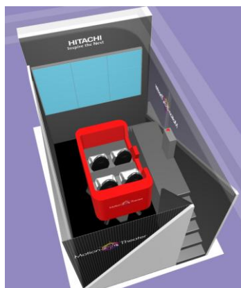
モーションライドシアター(イメージ)

4 人乗りの客席が動くモーションライドシアターでは、外界認識、ブレーキ、サスペンションといった走行安全技術や、電気自動車用の車両充電管理といった情報通信技術を活用した車の走行を、来場者がシミュレーションで体感できます。