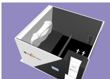
3D マッピングシアター(イメージ)

車の原寸大模型を立体スクリーンにして、3D の走行空間を体感できるシアターです。「環境」「安全」「情報」分野における高性能・高効率な部品やキーコンポーネントを、最適な電子・電動制御が可能なシステムとして連携させることによって、車のエネルギー・マネジメント効率を最大にする「次世代電動車両システム」を体感できます。