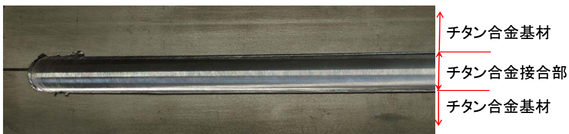
【写真】今回、開発したツールの接合試験結果 チタン合金の例