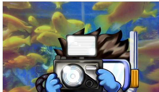
アイテムサーチ時の画面