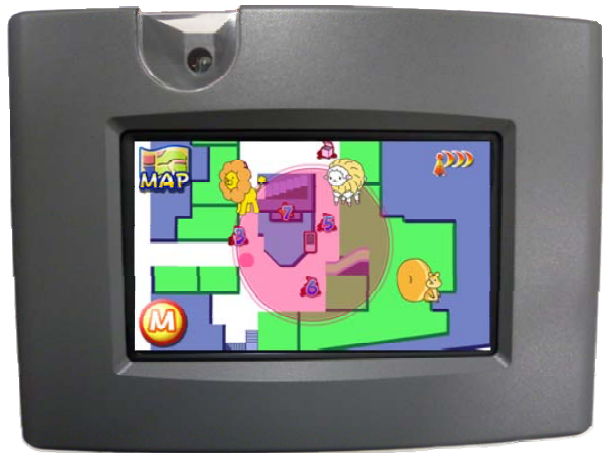
基本散策(通常マップ)画面