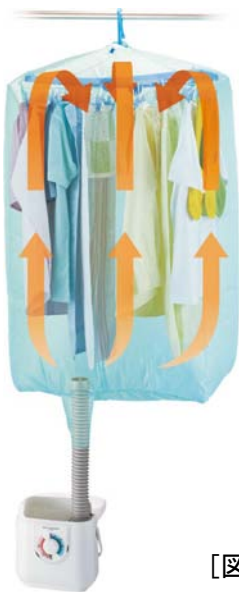
[図4 衣類乾燥イメージ]

*5 約120分 :脱水機で十分脱水し、室温約20℃、湿度約60～70%のとき 乾燥容量目安、約1kg (Tシャツ3枚、ハンカチ3枚、Yシャツ2枚、トラックス3枚、くつ下3枚、フェイスタオル3枚)