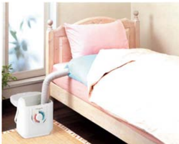
[図2 ベッドサイド使用イメージ]