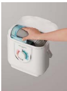
[図3 乾燥マット収納イメージ]

乾燥カバーを付けたまま、約80cmの伸縮式ロングホースがスッポリ収まる、大型カンタン収納を実現しました。出し入れに手間がかからず、毎日手軽に使用できます。