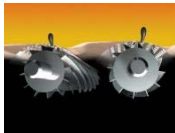
[図2 24枚刃力 ロータリー内刃]