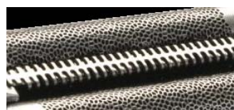
[図4 新高速ファインカット セントラトリマー]