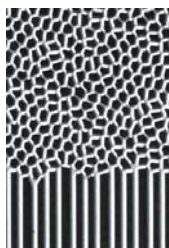
[図3 新マルチアングル外刃]