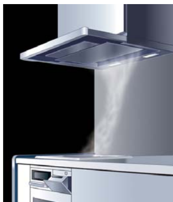
[図 4 グリルモード時 (イメージ図)]