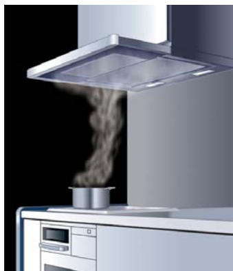
[図 3 標準モード時 (イメージ図)]

下側整流板を掃除する時は、「お手入れ」モードを選択すれば、ファンの回転が停止したまま下側整流板が手前まで移動し、楽な姿勢で拭き掃除ができます (図 5)。さらに、整流板はフッ素加工が施してあり、油汚れも簡単に拭き取れます。また、整流板の裏側などを掃除する際には、この位置で取り外して丸洗いすることも可能です。