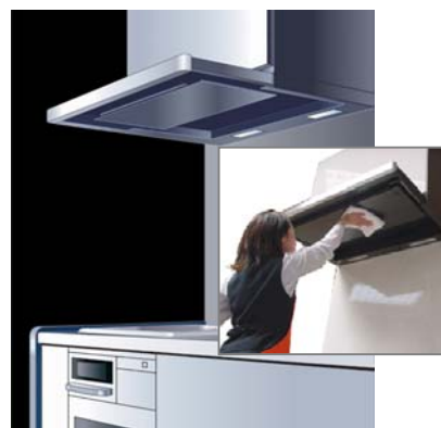
[図 5 お手入れモード時 (イメージ図)]