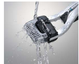
[図3 ロータリーウォッシャー]

内刃回転数が3,500回転/分の強力なモータートルク(モーターの回転力)のドライブユニットを引き続き搭載し、快適な剃り味を実現します。