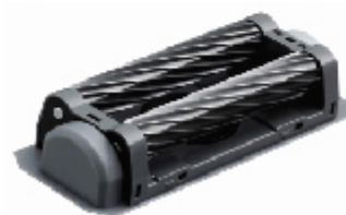
[図2 スパイラル内刃]